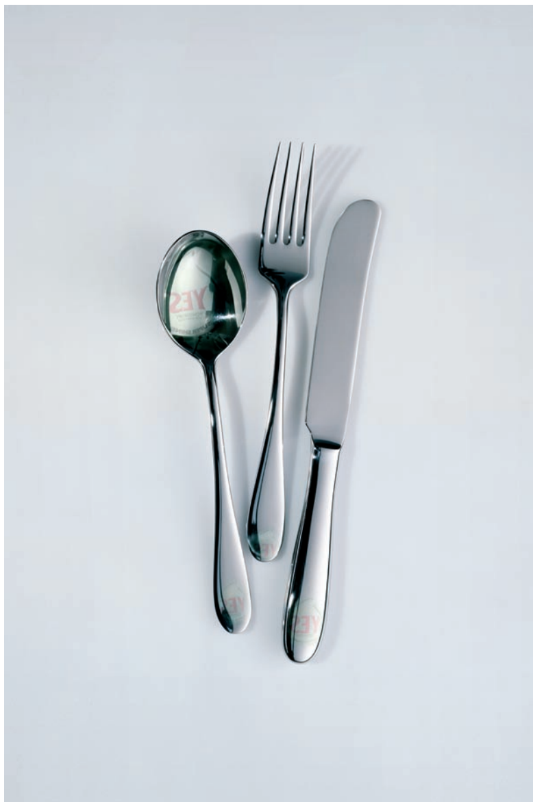
UPPDRAVSGIVARE: PROCTER&GAMBLE, YES/FAIRY ART DIRECTOR: STEN ÅKERBLOM COPYWRITER: MARTIN STADHAMMAR

DENNA BEGRÄNSADE INFORMATION (klätt i ett budskap) tar sig genom kommunikationsbruset ungefär som genom ett nyckelhål. Enkelhet är en dygd (i form och innehåll) eftersom liten, enkel signal ger stor respons. Signalen blir den nyckel, som förmår öppna låset till